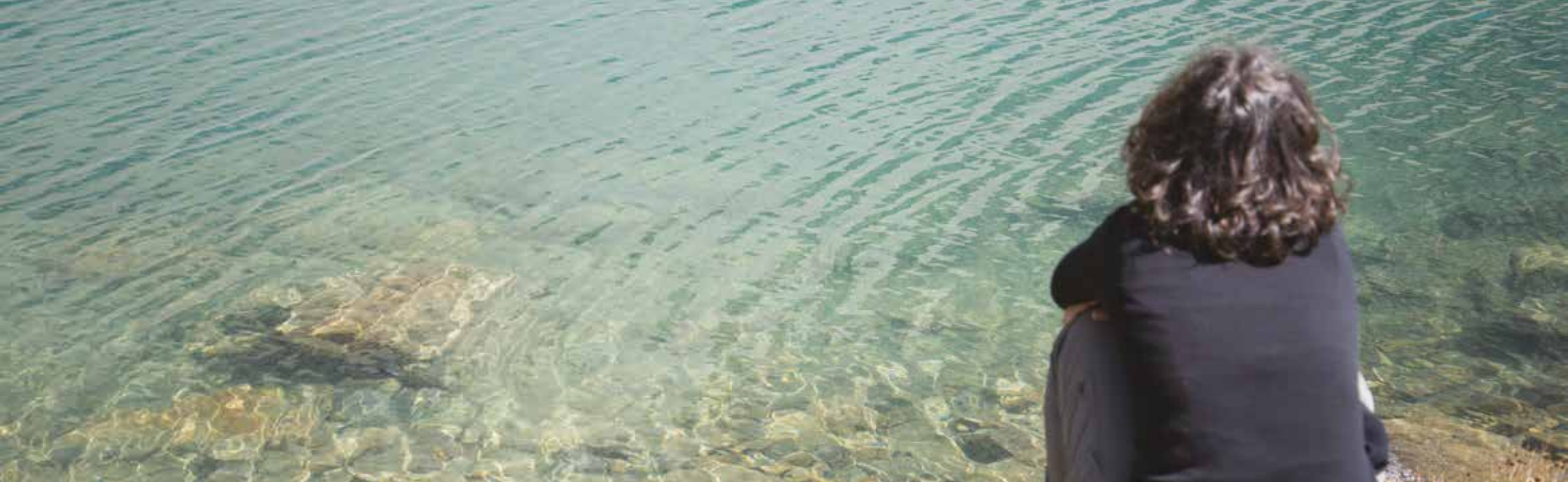
Figura 6. Particolare dell'acqua di lago alpino