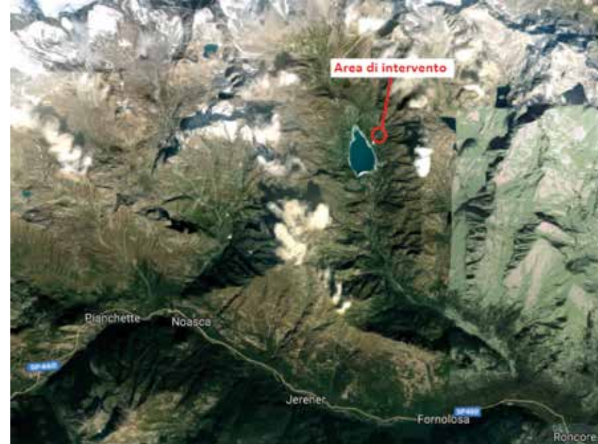
Figura 2. Localizzazione geografica dell'area di intervento

L'area prescelta per la realizzazione dell'impianto di fito-pedo-depurazione si trova all'interno del Vallone di Piantonetto nella valle dell'Orco ed è localizzata in prossimità del Rifugio Pontese, a quota 2.217 m s.l.m. Il Rifugio, di proprietà del Club Alpinistico Pontese, è posto all'inizio del Pian delle Muande, a monte del Lago di Teleccio, un bacino artificiale ubicato ad una quota di circa 1.924 m s.l.m. L'area d'intervento ricade all'interno del SIC/ ZPS IT1201000 Parco Nazionale Grande Paradiso (Figura 2).