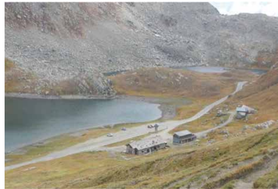
Figura 10. Il Rifugio Savoia visto dalla sentiero che porta alla malga. Di fronte al Rifugio è visibile il Lago Nivolet Inferiore.

Il rifugio è aperto dal 15 luglio alla fine di settembre. Ha 50 posti letto ed una ristorante di capienza mediopiccola. Esso è dotato di una fossa Imhoff che tratta le acque delle cucine e dei bagni.