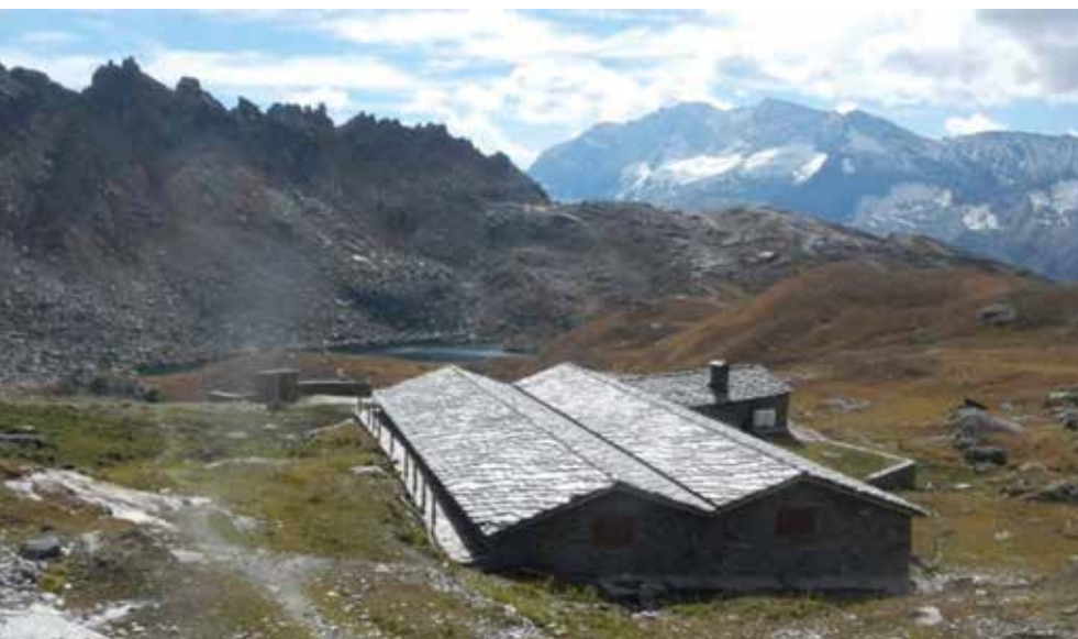
Figura 9. Vista della malga