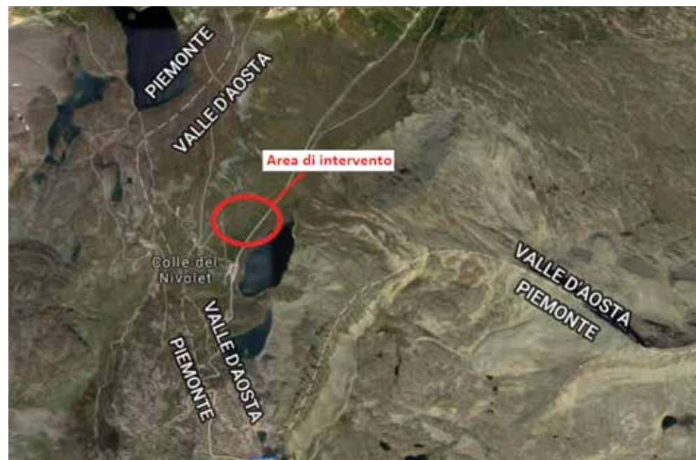
Figura 7. Localizzazione geografica dell'area di intervento

L'area interessata dall'intervento si trova ad una quota compresa tra 2.520 m s.l.m. (Lago Nivolet) e 2.620 m s.l.m. (malga), in prossimità dello spartiacque tra la Valsavarenche, bacino secondario della Dora Baltea e la Valle Orco (Figura 7). L'intervento di progetto ricade all'interno del SIC/ZPS IT1201000 -Parco Nazionale Gran Paradiso- e ha come scopo principale l'abbattimento del carico inquinante che si riversa nel Lago Nivolet alterandone lo stato trofico. Anche in funzione degli interventi in progetto, l'area di intervento può essere suddivisa in quattro elementi principali: il pascolo, il lago, la malga ed il rifugio.