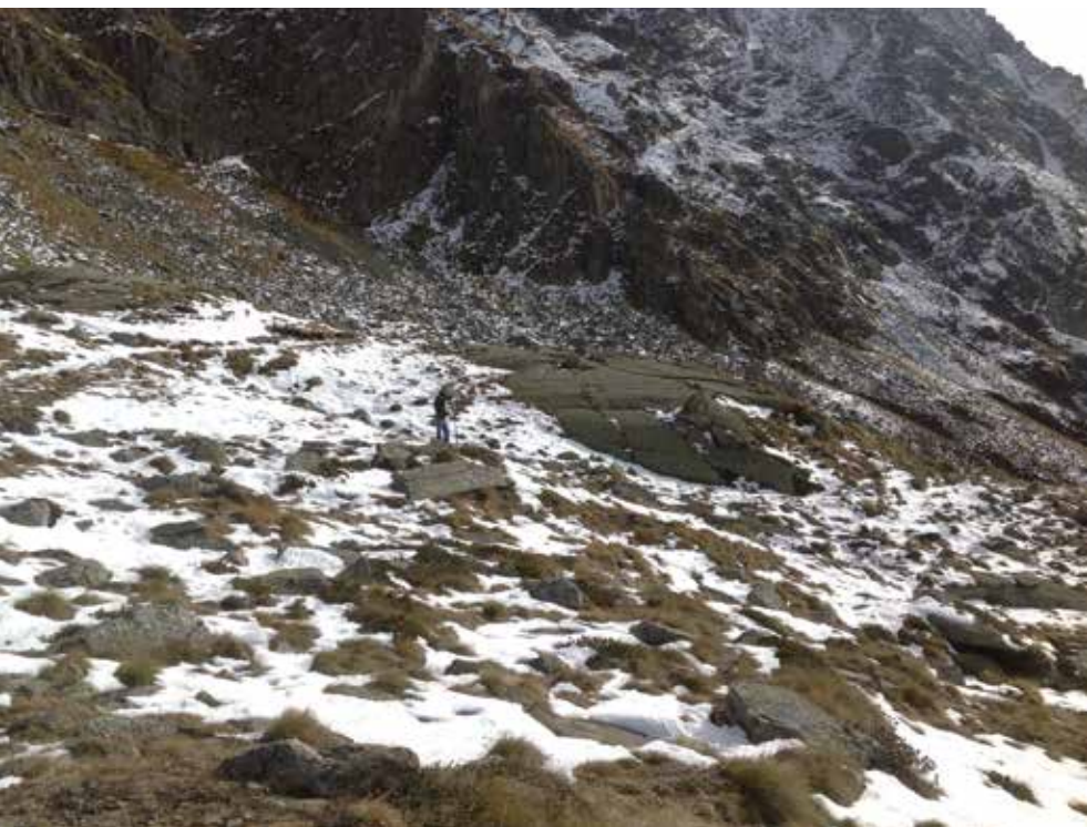
Figura 4. Immagine della zona dell'intervento prima della costruzione dell'impianto di fito-pedo-depurazione.

drenante di materiale grossolano contenuta da gabbioni metallici. L' impermeabilizzazione del fondo del bacino è stata effettuata utilizzando un manto in HDPE dello spessore di 0,6 mm, con resistenza a trazione e a lacerazione non inferiori rispettivamente a 25 kN/m e a 200 N. Il telo impermeabilizzante è stato posato su un telo antipunzonante in tessuto-non tessuto. Nello strato di terreno vegetale sovrastante la zeolite sono state messe a dimora zolle vegetate in parte tenute da parte durante i lavori di scotico superficiale ed in parte prelevate da aree adiacenti il rifugio e il Lago di Teleccio. Per la copertura del letto sono state impiegate specie erbacee autoctone tra cui Senecio cordatus , Leucanthemopsis alpina , Chenopodium bonus henricus .