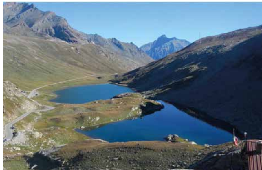
Figura 8. Vista dei Laghi del Nivolet dal Colle del Nivolet. Il Lago Nivolet Inferiore si trova sullo sfondo.

Quanto appena affermato è testimoniato dal fatto che, durante una campagna di misurazioni svolte dall'Istituto Italiano di idrobiologia di Pallanza nel 1981 ( Documenta dell'Istituto Italiano di idrobiologia dott. Marco de Marchi n° 9 - Indagini limnologica sui laghi alpini d'alta quota, 1986 ) è stata misurata una concentrazione di fosforo totale di 1 µg/l.