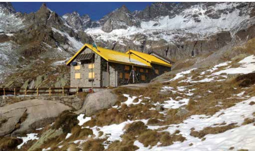
Figura 3. L'area di intervento. Nell'immagine di sinistra è visibile il Rifugio Pontese mentre nell'immagine di destra è rappresentata la vista del Lago di Teleccio dal rifugio.

L'area dove è stato costruito l'impianto di fito-pedo-depurazione si inserisce in un contesto tipicamente alpino, caratterizzato da piccole praterie e pascoli costituiti da cenosi erbacee molto povere e da pendii in forte pendenza. Il paesaggio è caratterizzato dalle forme delle grandi pareti rocciose grigie, costituite dagli gneiss del Gran Paradiso, modellate dall'intensa e geologicamente recente attività glaciale, ancora evidente in gran parte del Vallone del Piantonetto. Si rileva anche la presenza dei grandi circhi glaciali, che in sequenza cronologica testimoniano le fasi di progressivo ritiro glaciale dall'ultima avanzata: nelle parti più basse è presente attività vegetativa che ha già ampiamente colonizzato le superfici, mentre nelle zone più alte sotto le creste spartiacque, si osservano ampie coltri detritiche. Le forme montonate sono invece state lasciate dall'azione levigatrice del ghiacciaio sugli affioramenti rocciosi. Il Rifugio Pontese è collocato su un pianoro e spicca per contrasto coi colori delle vette e delle formazioni vegetali il giallo dell'edificio (Figura 3).