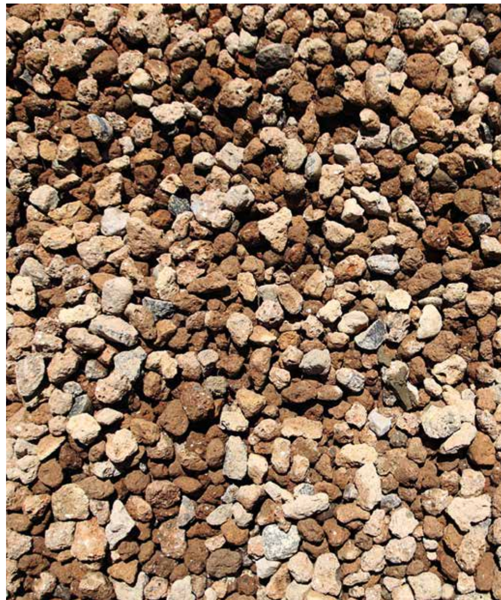
Figura 11. Un particolare degli zeoliti utilizzati nell'impianto

Oltre agli interventi descritti nel precedente paragrafo, relativi al solo impianto di fito-pedodepurazione, il progetto ha previsto la realizzazione di una staccionata in legno attorno al letto di fito-pedodepurazione, realizzata con materiali naturali, che delimita un'area complessiva di circa 400 mq.