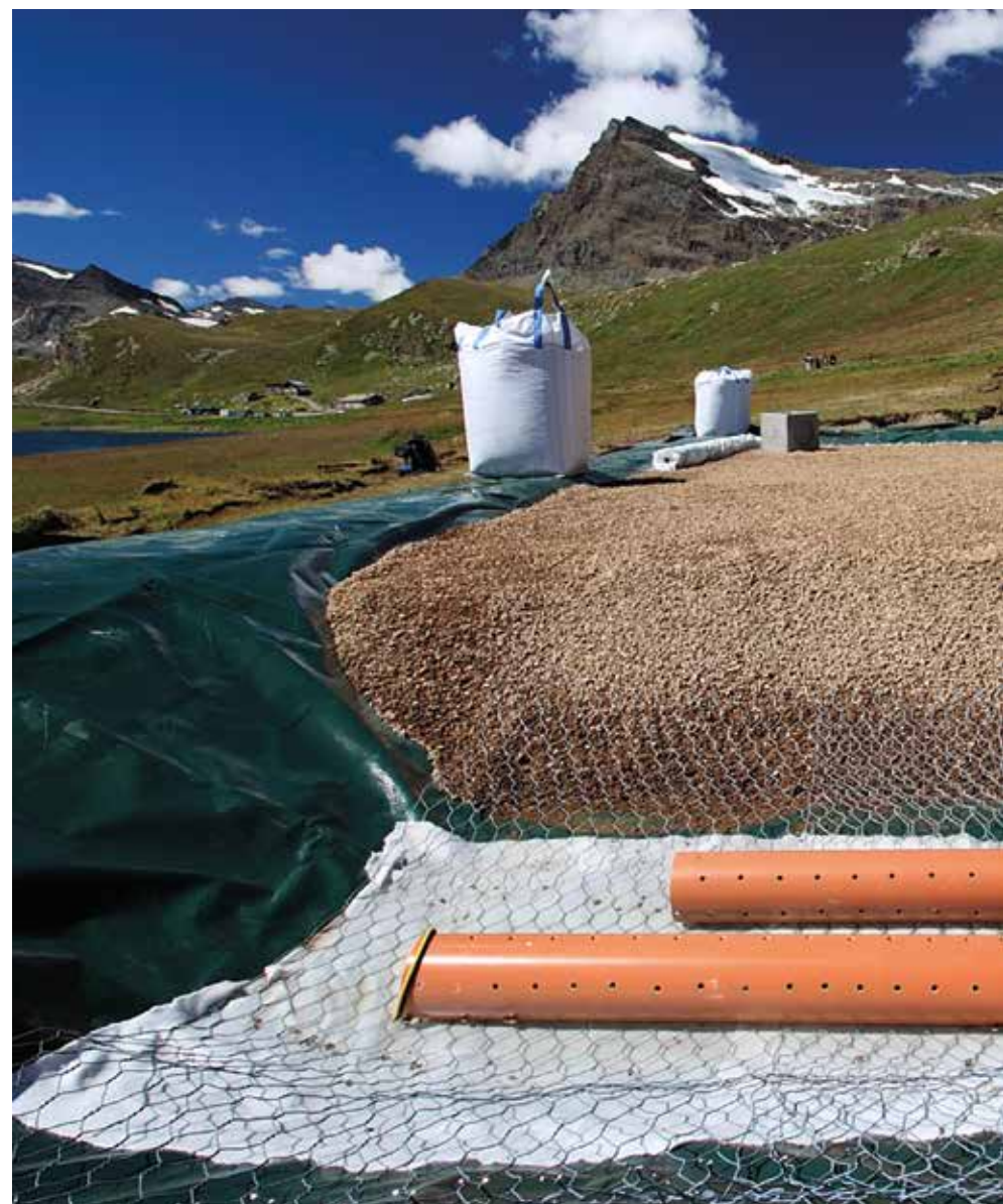
Figura 5 Una foto dell'area del Nicolet durante i lavori